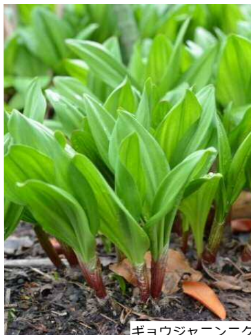
ギョウジャニンニク