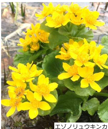
エゾノリュウキンカ

主催 | 北海道（保健福祉部健康安全局食品衛生課食品安全グループ、衛生研究所生活科学部薬品安全グループ） 札幌市（保健福祉局保健所）